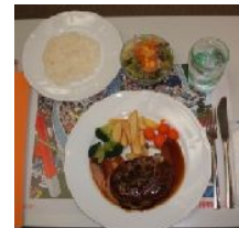
ハンバーグセット サラダ