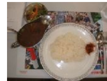
野菜カレー サラダ

会員総数 20名 出席者 10名 出席率50.00% 前々回補正出席率 95.00%