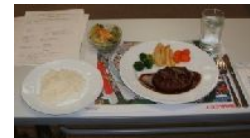
ハンバーグセット サラダ

会員総数 20名 出席者 16名 出席率 80.00% 前々回補正出席率 95.00%