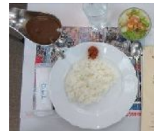
カレーセット サラダ

会員総数 20名 出席者 12名 出席率 60.00% 前々回補正出席率 95.00%