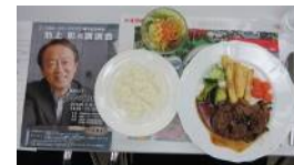
ハンバーグ サラダ