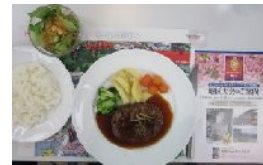
ハンバーグ サラダ