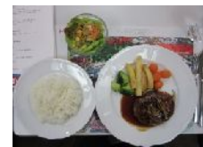
ハンバーグセット