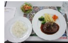
ハンバーグセット