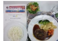
ハンバーグセット