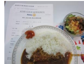
ビーフ カレーセット