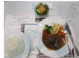
ハンバーグセット