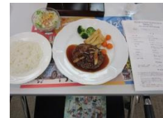
ハンバーグセット