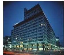
名古屋国際ホテル 「銀座」

<出席報告> 員総数 19 名 出席者 14 名 出席率 74.00% 前々回補正出席率 89.00%