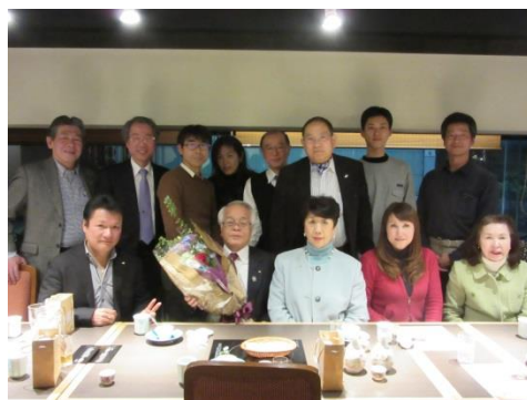
H30.1.16 新年第一夜間例会 木曾路 東名店