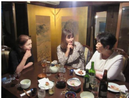
夜間花見例会 2018.4.3 <華野>. 尾張旭 RC 6 名の方も参加し、華野での夜間花見 例会を開催いたしました。