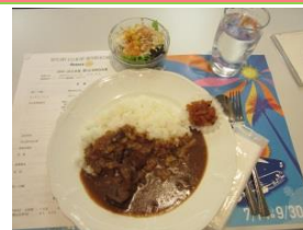
ビーフカレーセット

出 席 者 13 名 出 席 率 72.22 % 前々回補正出席率 83.89 %