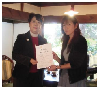
2020 年度米山奨学生面接官委嘱状授与