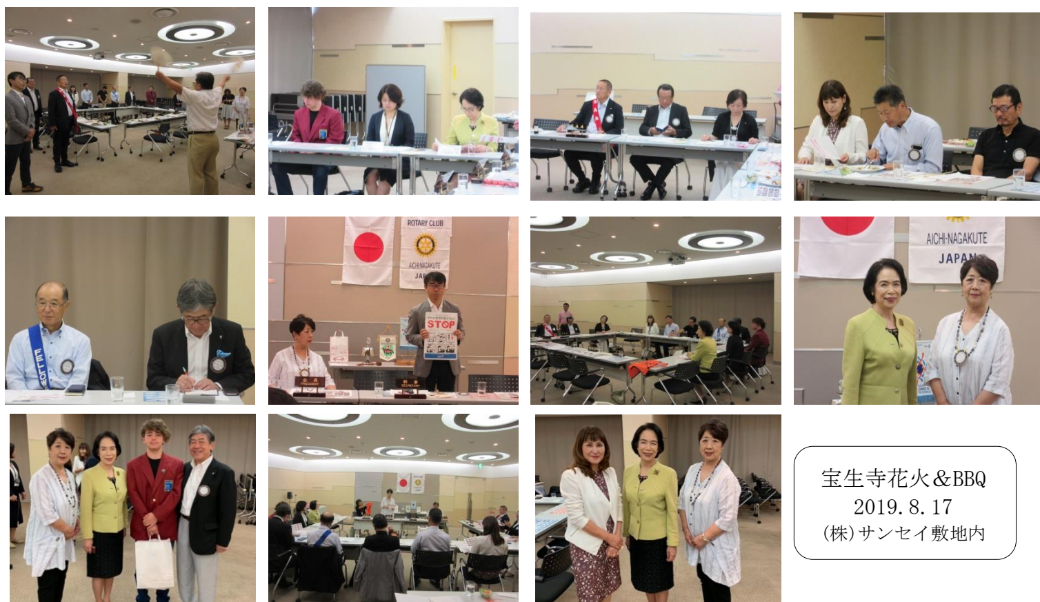
宝生寺花火&BBQ 2019. 8. 17 (株)サンセイ敷地内

会社を発展させるためのおもてなしそれは全ておもてなし。おもてなしを課題に挙げていかなければ発展はないと考えています。今の時代だからこそアナログ。お客様の情報を汲み入れたおもてなしをしなければいけない。その人の為の1台をご提案する。人と人との心のふれあいおもてなしの心をしっかりと捉えたうえで営業スタイルを発展していくことに力を注ぎました。星ヶ丘は本にもなったということで、いろんな業種の方から店舗見学研修依頼などがありました。本が出て6年くらいになりますが、おもてなしとはどの業種にも取り入れていかなければ発展はないと身をもって体験した。スタッフ同士がコミュニケーションがとれて、みんながおもてなしができていける所は、とても風通しが良く、チーム一丸になれば、頑張れる強い組織になっていける。一人一人の包容力、ホスピタリティが大切な時代になってくる。私は常に相手に対しておもてなしの気持ちが大切だと思う。言われたことだけをしてはいけません。まずはお客様に自分で何が出来るかを考えて行動しなければいけない。お客へのおもてなしの入り口はウェルカムの心。気づき、思いやりが大切である。